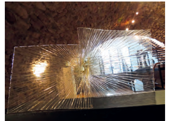
Hans König, Glasskulpturen. Bis September 2015 im LÖW HAUS.